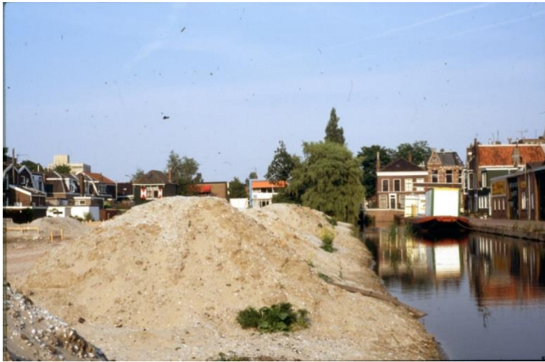
Olieslagerspad in wording

Verder wandelend van het Papenpad passeren we het nieuwe Olieslagerspad, dat aangelegd is op de achterkant van het Boumanspad. Na het Kauwerspad komen we bij de Harenmakersstraat.